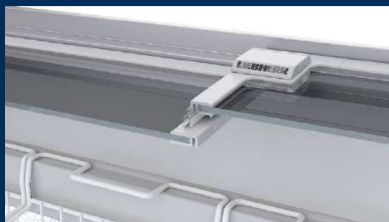
Vytvrdené jednovrstvové bezpečnostné sklo

Sklenené posuvné kryty umožňujú dokonalý pohľad na uložené výrobky a starajú sa o pôsobivú a presvedčivú prezentáciu tovaru. Skladajú sa z tvrdeného jednovrstvového bezpečnostného skla, vďaka čomu sú mimoriadne odolné.