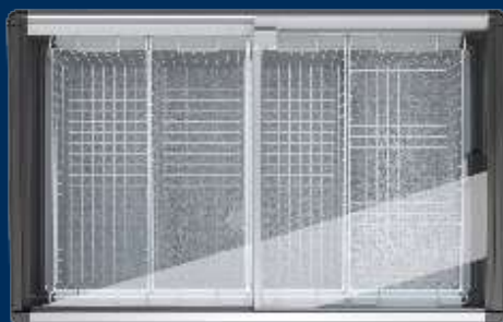
Posuvný sklenený kryt

Sklenené posuvné kryty umožňujú dokonalý pohľad na uložené výrobky a starajú sa o pôsobivú a presvedčivú prezentáciu tovaru. Skladajú sa z tvrdeného jednovrstvového bezpečnostného skla, vďaka čomu sú mimoriadne odolné.