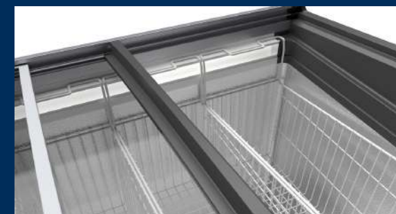
Pôsobivá prezentácia tovaru

Tvrdené jednovrstvové bezpečnostné sklo je nerozbitné, zaťažiteľné a ponúka stabilitu v hornej časti truhlice. Okrem iného je vďaka nižšiemu tepelnému žiareniu zaručený optimálny výhľad na skladovaný tovar. Pre ľahšiu manipuláciu a čistenie je možné kryt odobrať.